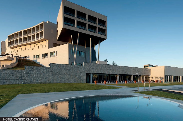
HOTEL CASINO CHAVES