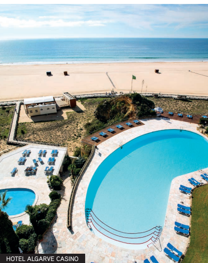
HOTEL ALGARVE CASINO