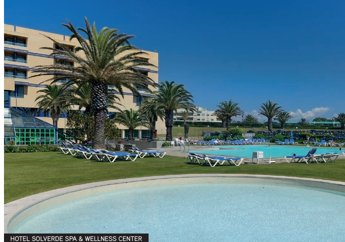
HOTEL SOLVERDE SPA & WELLNESS CENTER