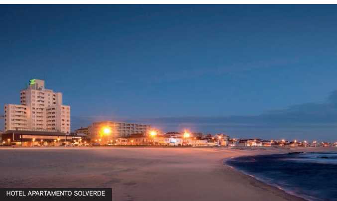
HOTEL APARTAMENTO SOLVERDE