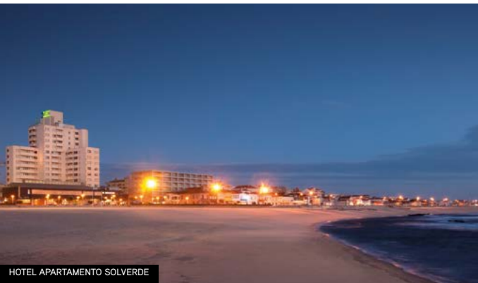
HOTEL APARTAMENTO SOLVERDE