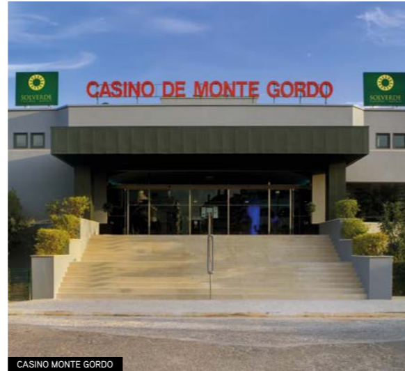
CASINO MONTE GORDO