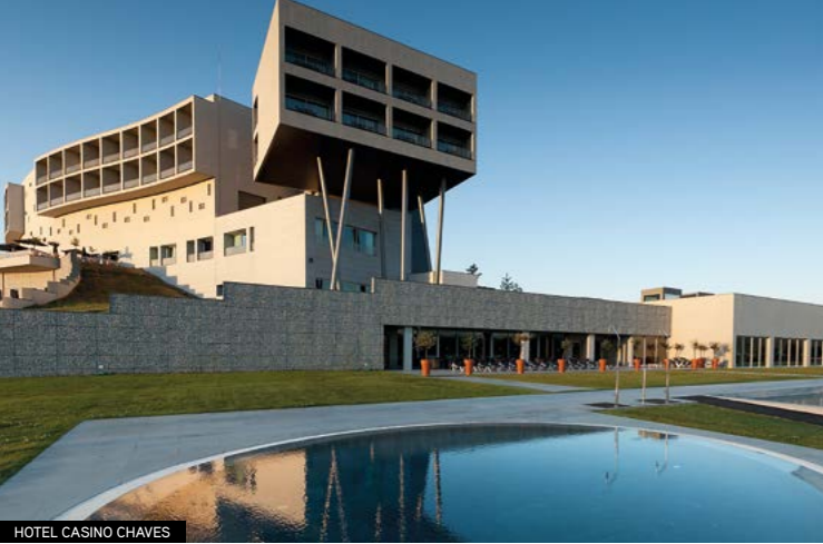
HOTEL CASINO CHAVES