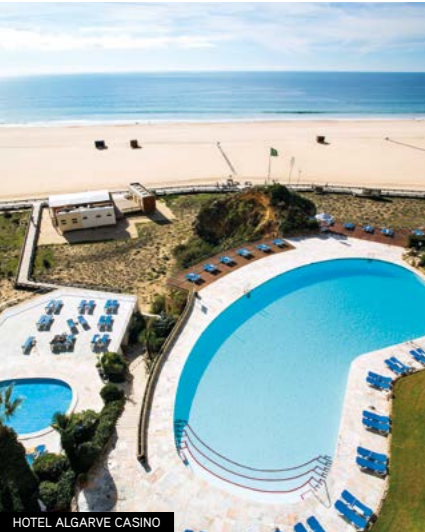
HOTEL ALGARVE CASINO