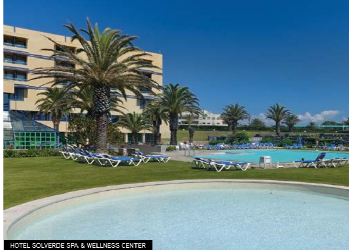
HOTEL SOLVERDE SPA & WELLNESS CENTER