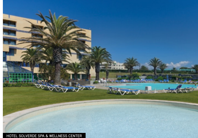
HOTEL SOLVERDE SPA & WELLNESS CENTER