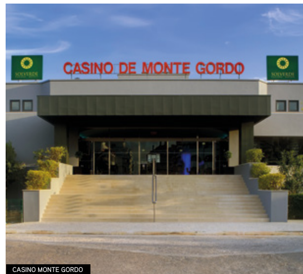
CASINO MONTE GORDO