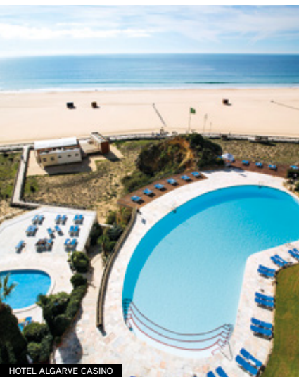
HOTEL ALGARVE CASINO