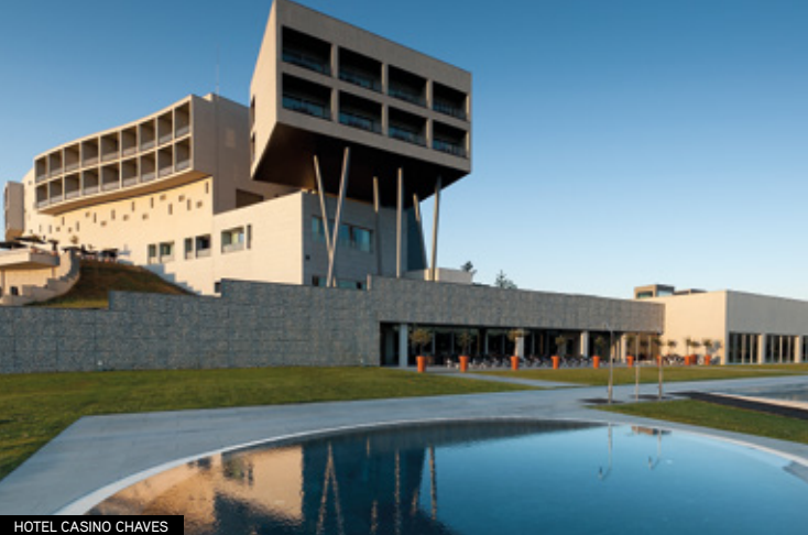
HOTEL CASINO CHAVES